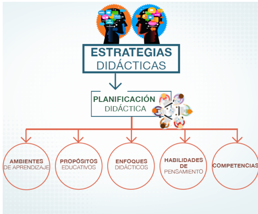
Imagen 1. Esquema Integral.